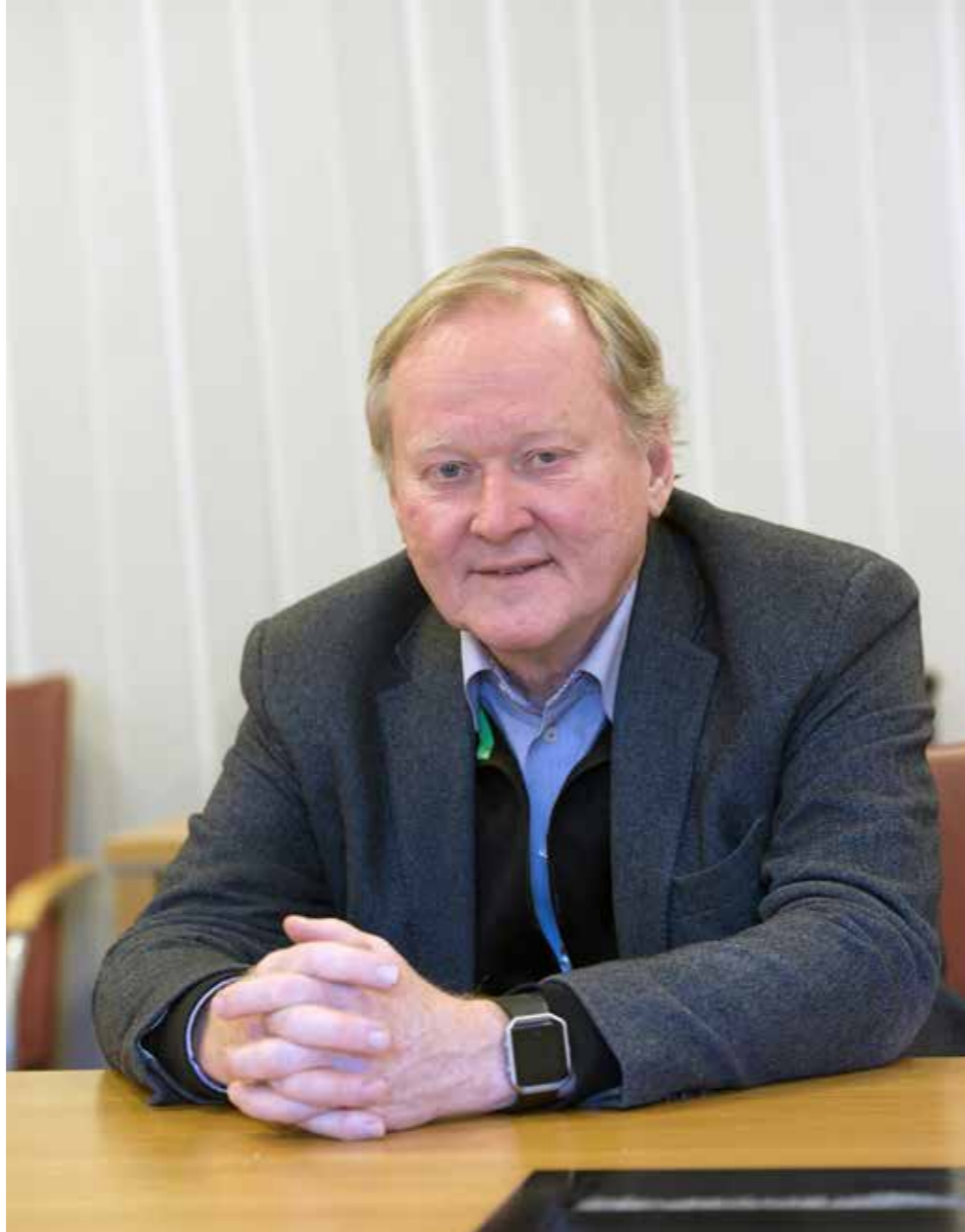
Leif Östling betonar värdet av ett fungerande samarbete med de fackliga organisationerna. Stora företag med nära relationer till de fackliga organisationerna blir ofta framgångsrika, säger han.