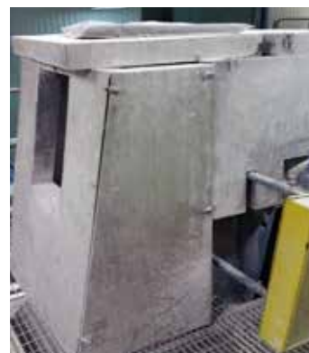
Inom industrin finns maskiner som alstrar buller. Det är viktigt att försöka förebygga men också att skydda öronen.